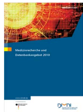
Datenbankangebot 2010 - Die Broschüre informiert umfassend über die Recherchemöglichkeiten beim DIMDI: Zu bestellen im DIMDI Webshop.

Beim DIMDI sind in Verlagsdatenbanken Volltexte aus zahlreichen medizinischen Zeitschriften online abrufbar. Darüber hinaus verlinken die Rechercheergebnisse zu Volltexten bei anderen Online-Anbietern. Ihre Verfügbarkeit wird dazu bei der Elektronischen Zeitschriftenbibliothek EZB bzw. über lokale Link-Resolver abgefragt. Nach entsprechender Registrierung können dabei Ihre eigenen Zeitschriftenlizenzen berücksichtigt werden. »